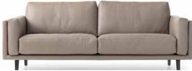
Leolux Bellice Design: Beck Design, 2017